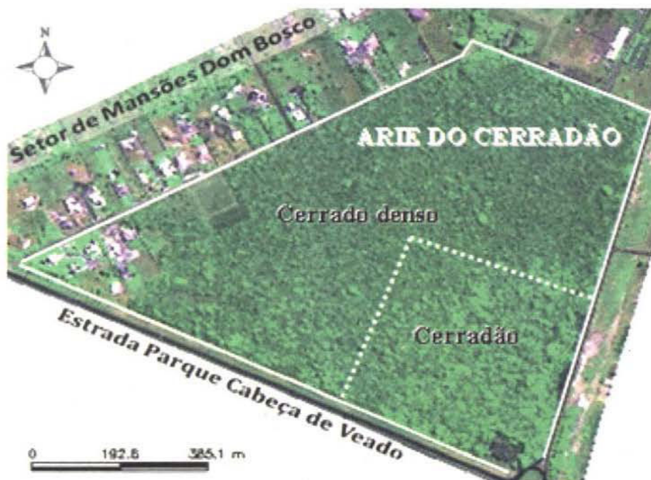
Figura 1. Número de espécies compartilhadas entre os cerradões da ARIE do Cerradão (ARIE), da APA Gama e Cabeça de Veado (APA) e do Distrito Federal (DF).

Figura 1 A elevada riqueza deste cerradão, com quase 95% de espécies nativas do bioma, aponta para a necessidade de se dispensar maior atenção à UC, já que esta abriga uma significativa mancha de cerradão, fitofisionomia pouco contemplada em Unidades de Conservação, além de servir de subsídio para a elaboração de projetos de manejo da ARIE, visto que possibilita o conhecimento da flora arbórea, arbustiva e herbácea da área, até então nunca estudada.