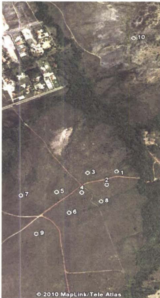
Figura 1 – Distribuição das 10 parcelas de cerrado sentido restrito sorteadas nos trechos de solos rasos da EEJBB. A área de estudo está localizada no vale do córrego Cabeça-de-Veado, na região Nordeste da EEJBB.

ciais, foram delimitados os principais dois trechos de cerrado sentido restrito em solos rasos e terrenos ondulados e suave-ondulados no vale do córrego Cabeça-de-Veado (declividade entre 5% e 20%), na região Nordeste da EEJBB. Foram alocadas 10 parcelas de 20 x 50 m ao longo dos trechos selecionados, efetuando-se sorteio das parcelas, conforme as diretrizes do Manual de Parcelas Permanentes dos biomas Cerrado e Pantanal (Felfili et al. 2005). Em função da pequena representatividade desse tipo de cerrado, dentro da EEJBB, foram alocadas parcelas com distância de 100 metros a 1000 metros linearmente ( Figura 1 ).