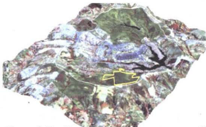
Figura 2. Famílias mais ricas na amostragem realizada em cerrado sensu restrito sobre solos rasos na Estação Ecológica do Jardim Botânico de Brasília. Fabac = Fabaceae, Vochy = Vochysiaceae, Malpi = Malpighiaceae, Myrta = Myrtaceae, Melas = Melastomataceae, Nycta = Nyctaginaceae, Eryth=Erythroxylaceae.

As famílias mais ricas estão representadas na Figura 2 , sendo que sete famílias foram representadas por duas espécies e outras 14 por apenas uma espécie. A família Leguminosae possui grande importância em riqueza por toda a região Neotropical (Gentry 1995), e também se apresenta como a família mais diversificada na maioria dos levantamentos realizados no Cerrado (Felfili et al. 2002, Silva et al. 2002, Assunção & Felfili 2004). A família Vochysiaceae possui espécies consideradas acumuladoras de alumínio que se adaptam as características distróficas dos solos onde, em geral, os cerrados se desenvolvem (Haridasan et al. 1997). Ambas as famílias foram registradas com alta riqueza nas amostras das demais áreas usadas para comparação no presente estudo ( Tabela 2 ).